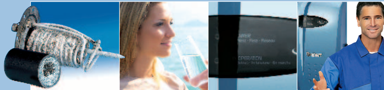
— SICHERHEIT — TRINKWASSERGARANTIE — KOMFORT — SERVICEGARANTIE —

Wenn Sie genug haben von wirkungslosen Magneten, Spulen- und Aufsteckgeräten: AQA nano von BWT.